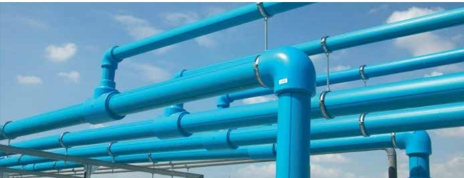
Fotografía realizada previamente a la colocación de aislamiento.